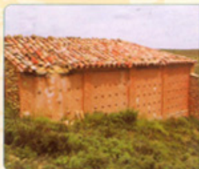
Cortes de Aragón ( Cuencas Mineras )