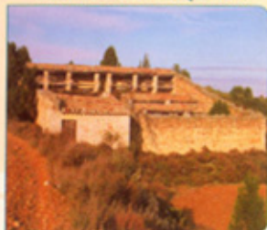
Castellón de Monegros ( Monegros )