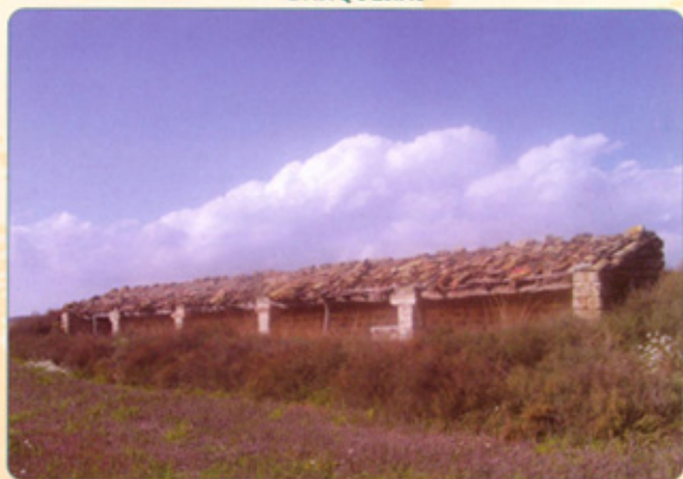
Castellón de Monegros ( Monegros )