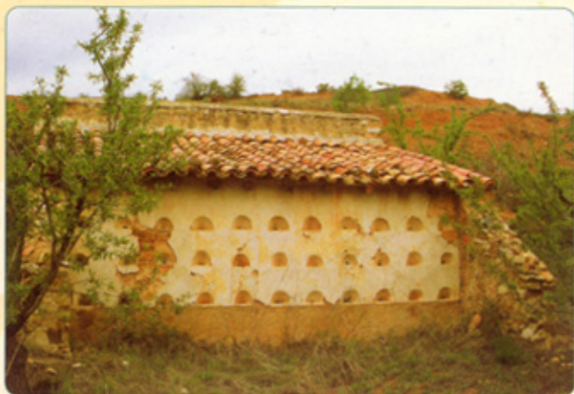
Daroca ( Campo de Daroca )