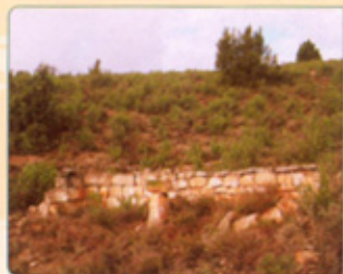
Castellón de Monegros ( Monegros )