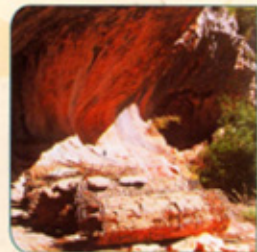
Lecina ( Sobrarbe )