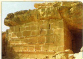
Caspe ( Bajo Aragón - Caspe / Baix Aragó - Casp )