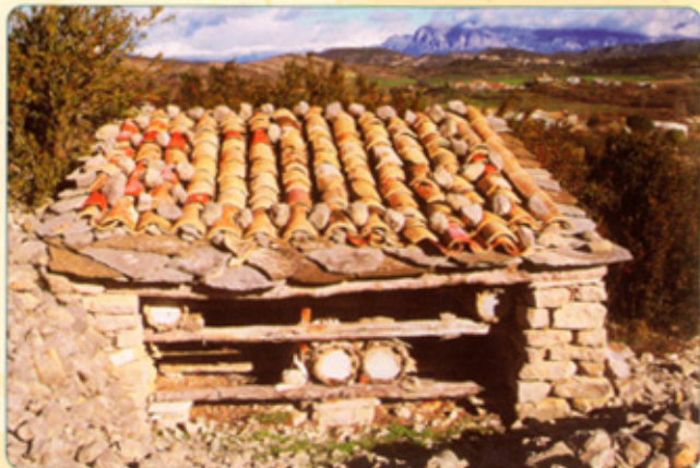
Santa María de la Nuez ( Sobrarbe )