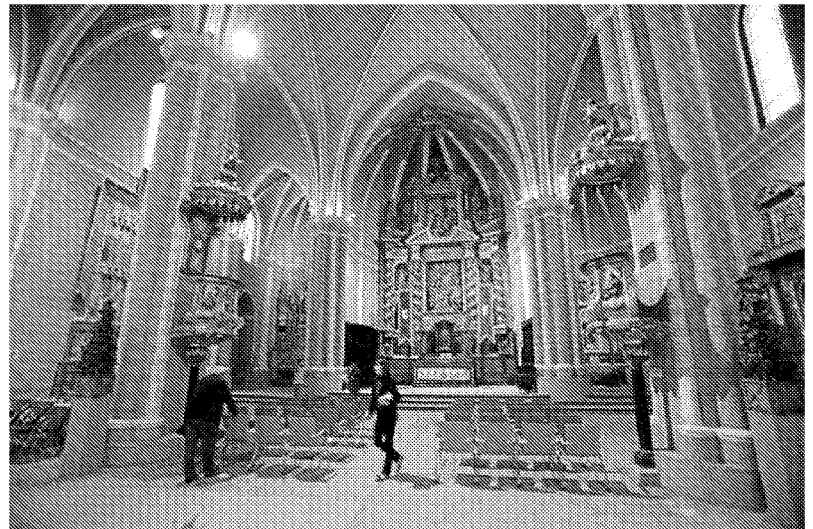
La iglesia de San Pedro de los Francos, en Calatayud, en una imagen de archivo.

Morata de Jiloca dedica su iglesia a San Martín de Tous. Tiene una nave única unida a una cabe-