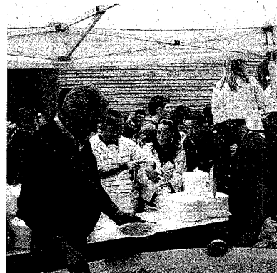
► Participación ► Los peñistas disfrutaron la fiesta.