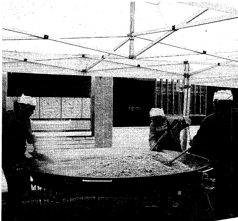
► Comida ► Una gran cazuela de migas con chorizo deleitó a los 700 comensales de la fiesta.

Y, tras los talleres, la comida: migas con chorizo y longaniza a la brasa, cocinadas bajo una carpa en la calle, un menú elegido a través de las redes sociales. No todos los 700 comensales fueron peñistas, ya que 300 entra-