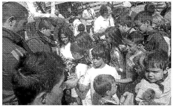
Los recortadores repartieron anillas entre los más pequeños de Mallén.