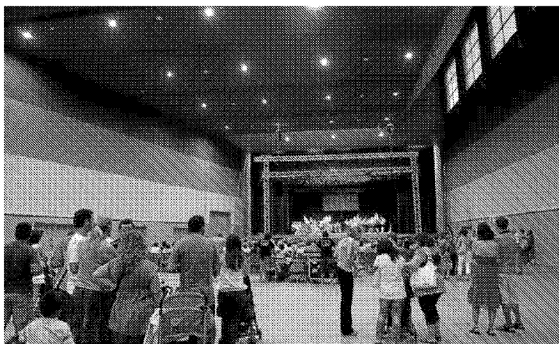
◆ SALA MULTIUSOS Añega multitud de actos musicales y folclóricos para todos los gustos.

LOS PROPIOS VECINOS Y ESTABLECIMIENTOS DE ÉPILA HAN BRINDADO SU COLABORACIÓN PARA ESTAS FIESTAS