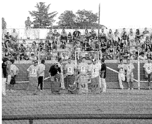
◆ GRAND PRIX Uno de los actos más divertidos, que se celebra en la plaza de toros.

Igualmente, los bares de la localidad contribuyen a la buena marcha de las fiestas con la organización de campeonatos, juegos y concursos varios. Ejemplo de ello es la September-Fest que organiza hoy el Bar Café 63, el campeonato de póquer del Bar Vanguard de mañana, los juegos tradicionales del domingo por el Pub Tiffany's o el campeonato de fútbol del próximo martes, entre otras propuestas. ■