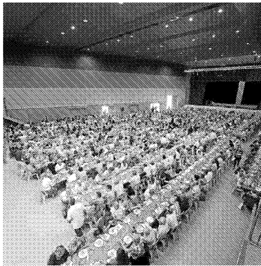
◆ COMIDA POPULAR Con 1.500 personas, es característica de las fiestas de Épila.

DIVERSION Y EMOCIÓN Mañana por la tarde, en la plaza de toros, tendrá lugar el Concurso Nacional de Recordadores de Anillas. Poco después se celebrará uno de los actos más vis-