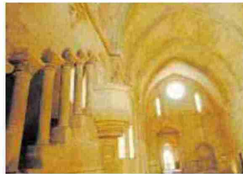
► Turismo ► Rueda tiene una hospedería.

docena de bodas anuales, lo que repercute en el turismo de la zona».