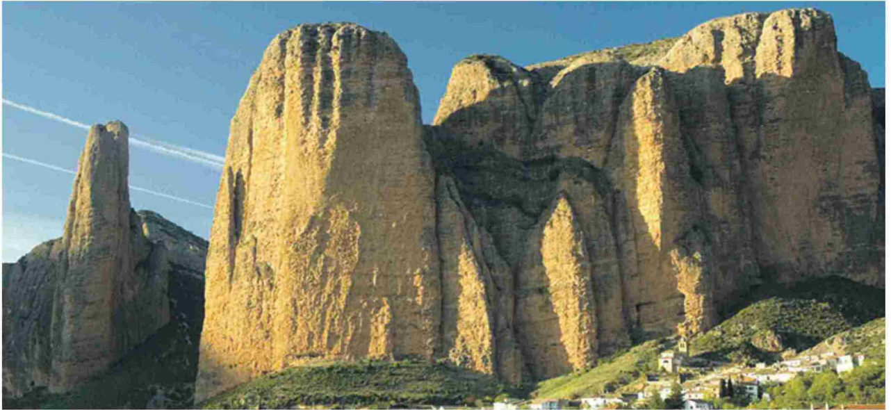
Los imponentes Mallos de Riglos están presentes en algunas de las rutas. S.E.