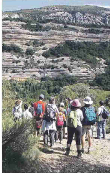
Bosque encantado de Vadiello. S.E.

En esta edición son 22 las rutas que se han programado, doce de las cuales son interpretativas (cuatro que muestran elementos del patrimonio y ocho meramente medioambientales) y diez, deportivas (cinco de ellas de BTT y