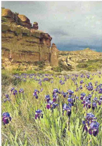
Bonito paisaje de Piracés. JOAQUÍN BARRABÉS

El objetivo principal es acercar tanto a los propios habitantes del territorio como a los visitantes llegados de fuera el conocimiento y comprensión de la riqueza del entorno rural de la comarca, a través de visitas guiadas de interpretación ambiental sin dificultad, apta para todos los públicos. Este primer objetivo ya se