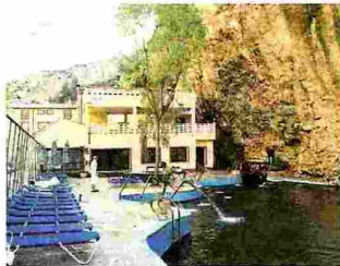
Balneario de La Virgen