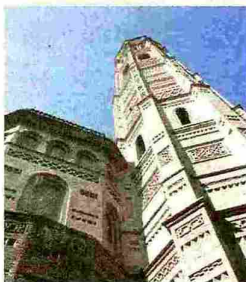
Torre de la Iglesia de Santa María, en Calatayud