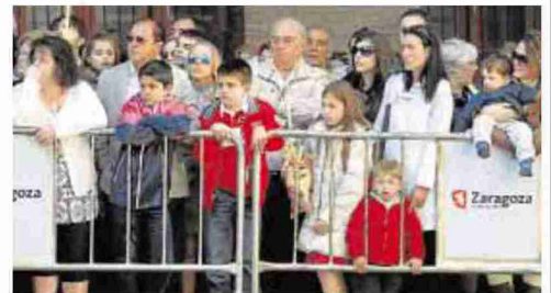
► Público ► Personas de todas las edades se dieron cita en el centro.