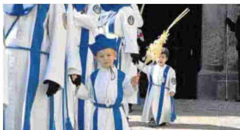
► Niños ► Los más pequeños tampoco faltaron a la cita con su cofradía.