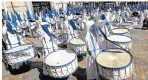
► Ruido ► Los tambores y los bombos tocaron al unísono.