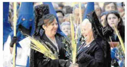
► Mantilla y peineta ► La presencia de las 'manolas' es una tradición.

tando más palmas y ramas de olivo. En ese momento, el ruido se volvió más ensordecedor. Preludio de lo que iba a ocurrir a continuación. Eran exactamente las 12.25 cuando la exultante talla de la Entrada de Jesús en Jerusalén salía de la iglesia de San