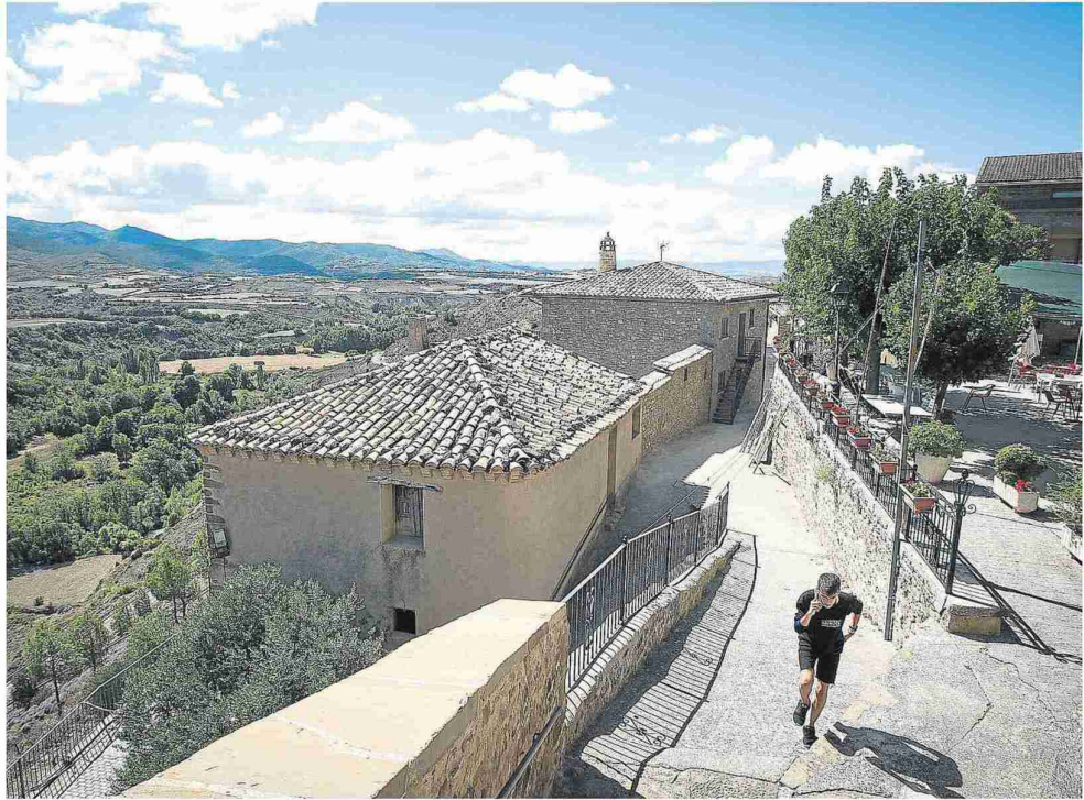
Vista desde El Balcón d'Onsella, en el centro de Isuerre.