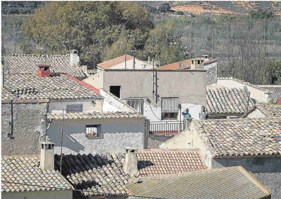
Las siluetas de dos vecinos se marcan entre los tejados de Lagata. L.U.