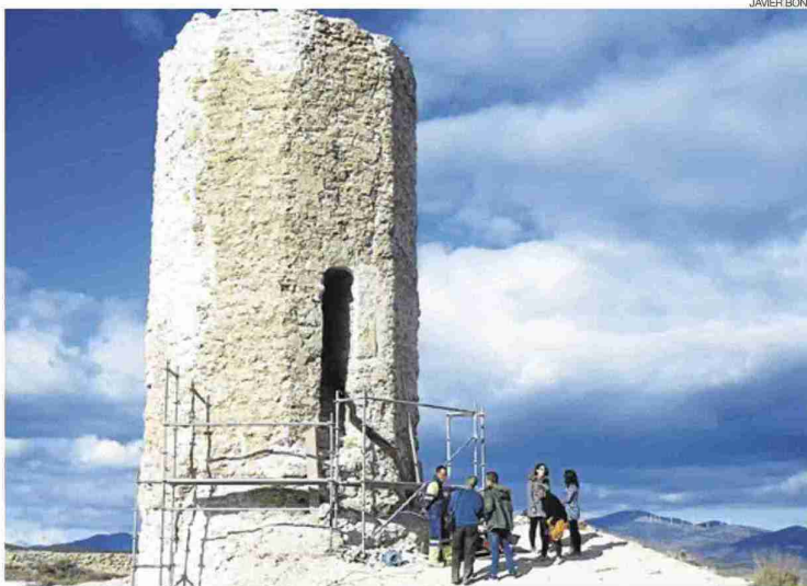
▶ Trabajos de restauración en la Torre Mocha, en Calatayud.

Por otro lado, la financiación con la que cuenta el consistorio para llevar a cabo esta obra procede del Plan de Bienes Inmuebles de Titularidad Municipal de la DPZ en el que la institución pro-