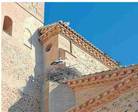
Cigüeñas en la iglesia de San Pedro. N. B.