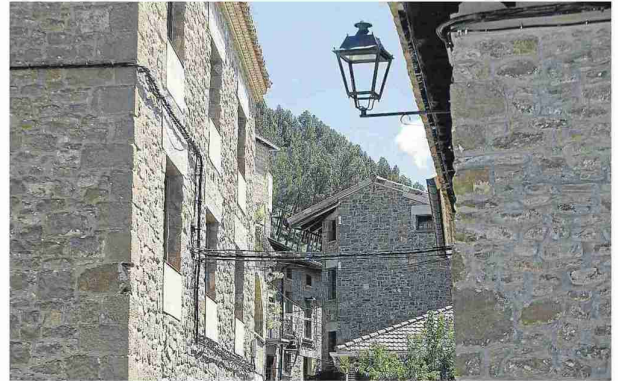
Navardún se caracteriza por la belleza de sus casas de piedra. L.U.