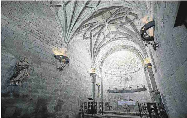
Interior de la iglesia de Nuestra Señora de la Asunción. L.U.