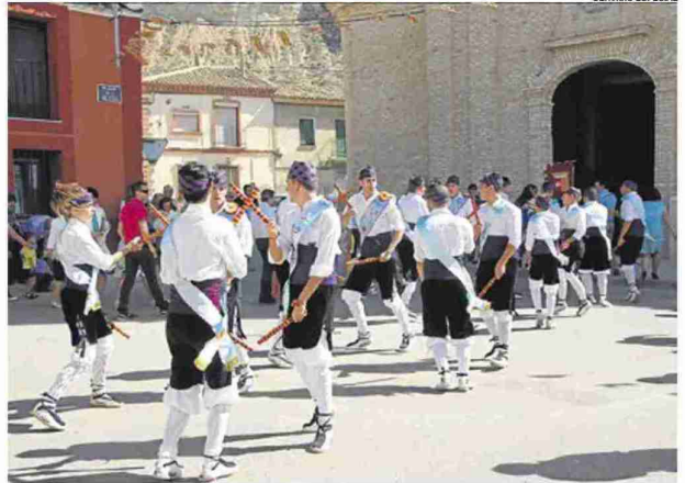
Tradición. Actuación de los danzantes de Remolinos.

► Incluyen eventos y actos para todas las edades