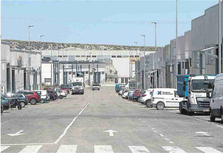
Vía del polígono Valdeconsejo. L. U.