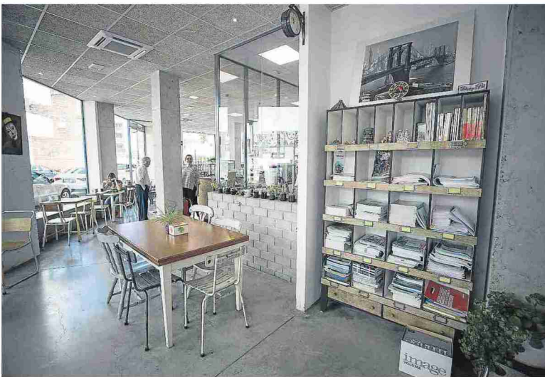
Interior del multifuncional establecimiento El Sombrero Loco. L. U.