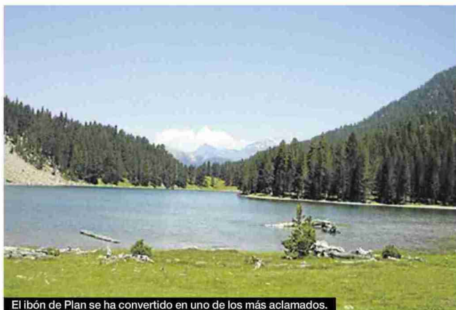
El ibón de Plan se ha convertido en uno de los más aclamados.