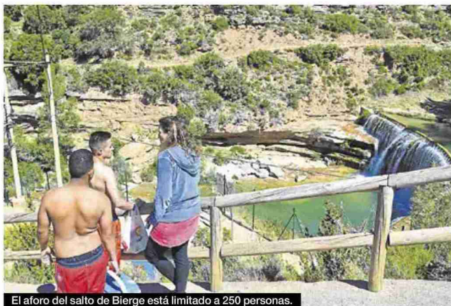
El aforo del salto de Bierge está limitado a 250 personas.

ÁNGEL DE CASTRO / ÁLVARO SÁNCHEZ / EL PERIÓDICO