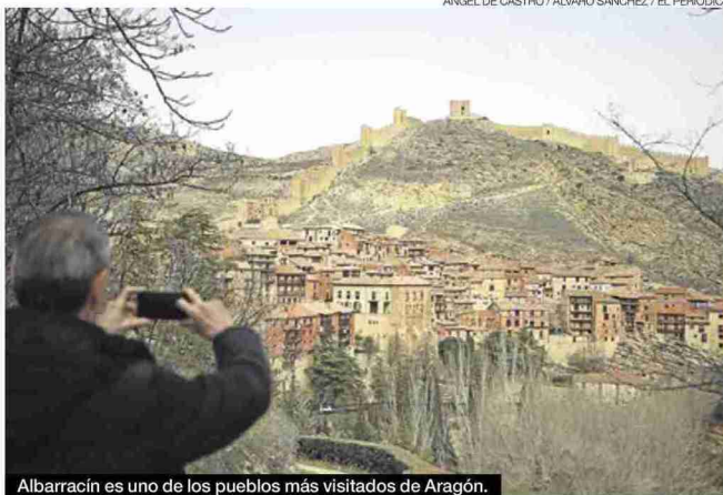
Albarracín es uno de los pueblos más visitados de Aragón.