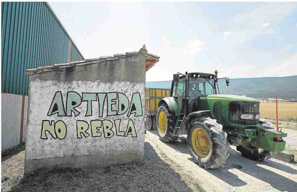
La defensa que hace Artieda de su tierra frente a los planes de recrecimiento de Yesa está en todas partes, hasta en la báscula. L.URANGA