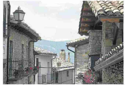
Detalle de los bonitos tejados de Artieda. L.U.