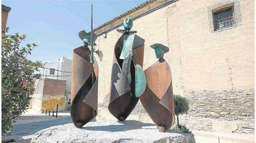
Escultura de Cervantes y Don Quijote que luce en la plaza de España de Pedrola. L. URANGA