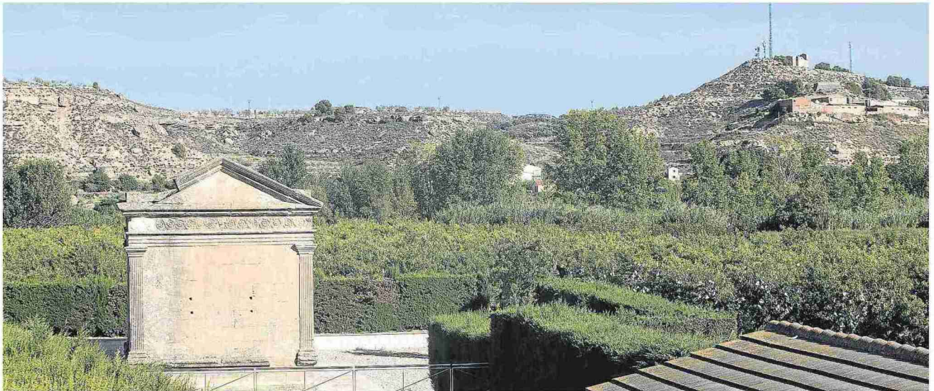
Mausoleo romano de Fabara, con las primeras casas del pueblo al fondo. L. URANGA