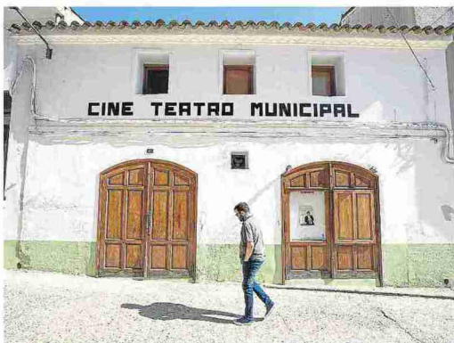
Fabara abre semanalmente su sala de cine. L. U.