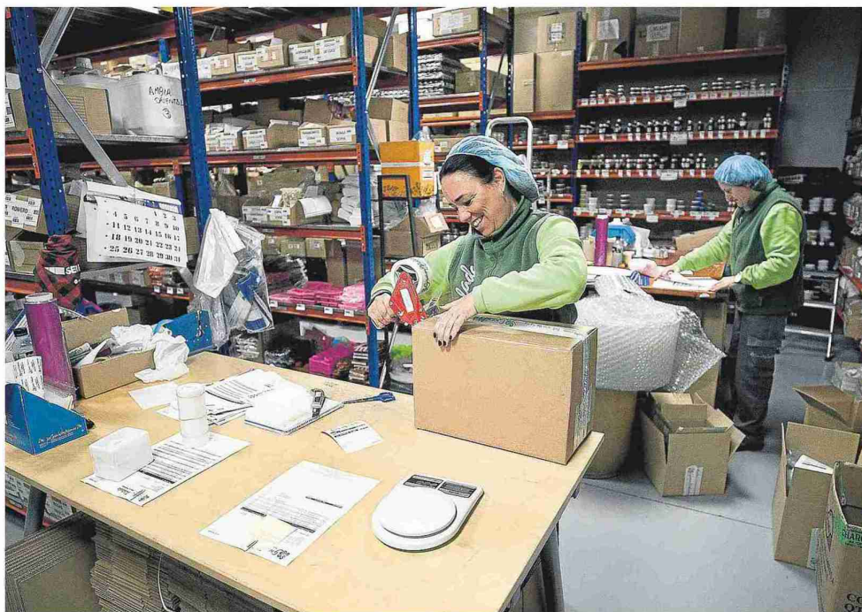
Dos trabajadoras de Gran Velada trabajan en el almacén de la empresa; preparan producto para su comercialización. LAURA URANGA

En la calle La Jota de Magallón se rinde homenaje al compositor Abel Moreno, muy ligado al pueblo en afecto y obra; dirigió la Escuela de Música del Ministerio de Defensa, y fue pregonero de la Semana Santa de Zaragoza en 2007.