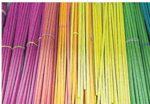
Varillas de colores en la tienda de Gran Velada. L. U.

Magallón es tierra de música en general, y de jota en particular. El maestro Ramón Salvador compuso la pieza más famosa del lugar, 'La pulida magallonera', llamada popularmente 'La olivera' por un pasaje de sus versos más famosos, que rezan así: 'Pulida magallonera/anda y dile al Santo Cristo/que cuando me llame al cielo/que me cante la olivera'. El 19 de enero de 2014, el pueblo celebró la inauguración de una escultura dedicada a la protagonista de esta jota y, por extensión, a todas las