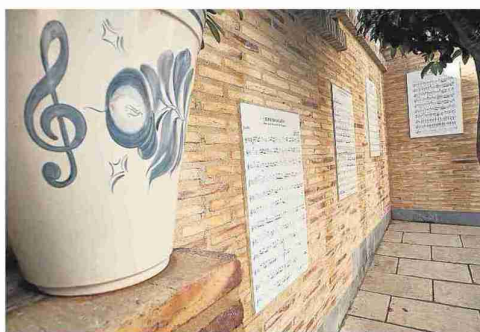
El Rincón de la Música de Magallón. L. U.

curso de animación. El Ayuntamiento le encargó el trabajo a principios de 2013 y en mayo de ese año, presentó los primeros bocetos, seguido de un modelado en barro a tamaño reducido para su aprobación en el Ayuntamiento. Marta realizó después la escultura definitiva a tamaño natural (1.80) y su fundición se hizo en los talleres de Francisco Torres, de San Juan de Mozarrifar, que hoy saluda a los habitantes y visitantes de Magallón desde el centro neurálgico de la villa. P. F.