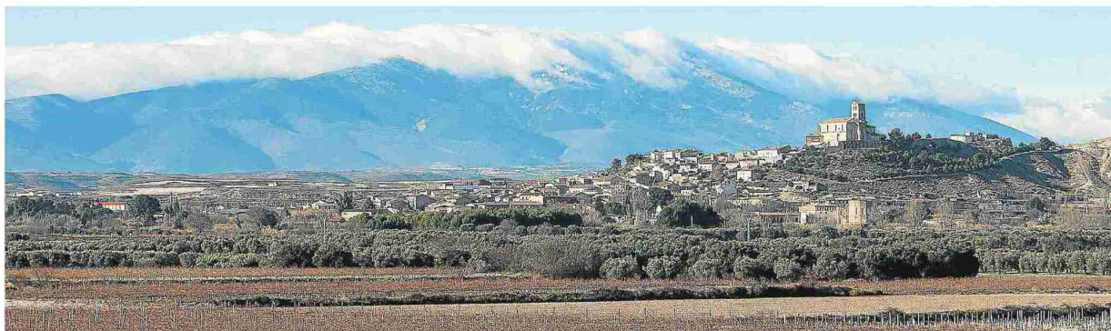
Vista panorámica de Magallón, con el imponente Moncayo al fondo. L. URANGA