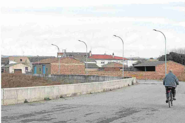
Un vecino se acerca en bicicleta al casco urbano de Cabañas. L. U.