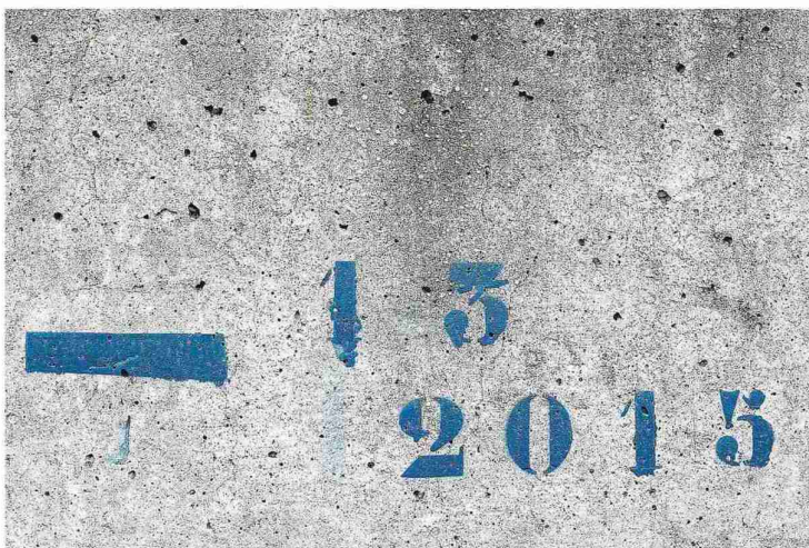
La marca de la última gran riada, en el muro de contención del principal meandro local. L. U.