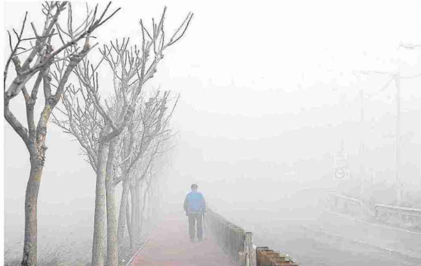
La niebla es una visitante asidua en Alcalá de Ebro. L. U.