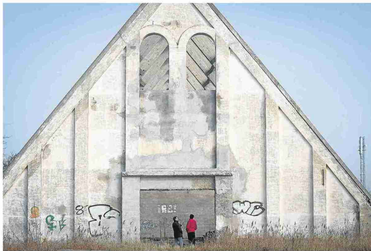
'La Pirámide' de Pura Sal, ejemplo de arquitectura industrial aragonesa. L. LURANGA

Sobre el gobierno de Sancho Panza, el 'ebronauta' también deja una perla. «Para ridiculizarlo, los señores de Villahermosa lo pusieron de gobernador. Lo hizo muy bien, dirimió un conflicto de una deuda con mucha sabiduría. Además -ríe- a los tres días dimitió. ¡Un político ejemplar!»