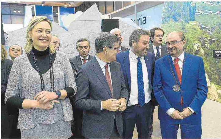
El presidente de la DGA, junto a representantes del Gobierno central, consejeros y parlamentarios, E. C.