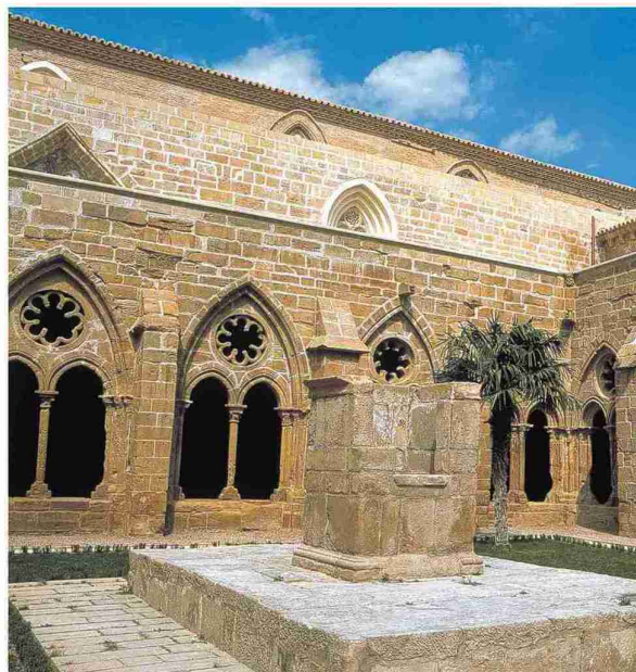
▲ Claustro del monasterio, con sus arcos góticos y la torre mudéjar.

En la visita también se recorren parte de los espacios verdes del