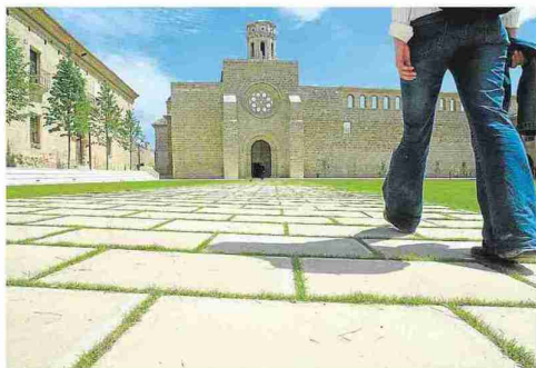
▲ Fachada del complejo monacal.

» ABIERTO EN FESTIVOS, FINES DE SEMANA Y DURANTE LOS MESES DE VERANO