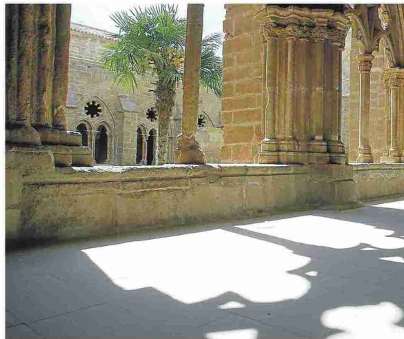
▲ Pasillos interiores del claustro del monasterio de Rueda.

monasterio, de gran importancia en el día a día de todo el complejo, donde siempre se prestó atención a los jardines, regados por una red hidráulica propia que permitía, entre otras cosas, el cultivo y desarrollo de plantas medicinales.