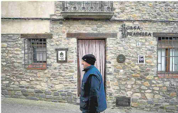
La casa rural Pradilla es la más activa de Maleján. L. U.