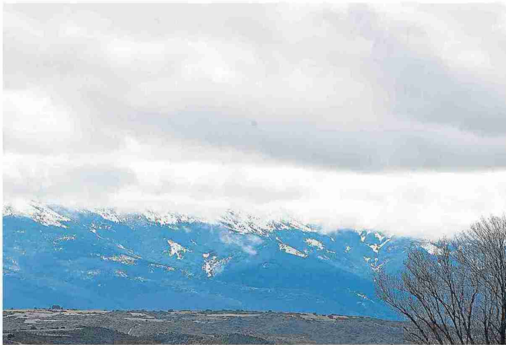
Una hermosa vista del Moncayo la semana pasada, antes de las grandes nevadas de la actual. L. URANGA

mucha gente joven, un colegio con dos profesores fijos y uno en jornada no continua. Al estar tan cerca de Borja no notamos tanto el problema de la despoblación, porque mucha gente que trabaja allí o en los polígonos cercanos elige quedarse en Maleján por la tranquilidad. Para nosotros supone contar con todos los servicios de Borja, además.