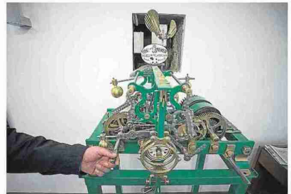
El hermoso reloj de Canseco que conserva el pueblo. L. O.