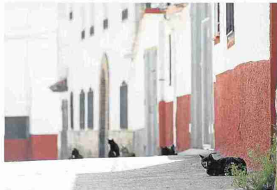
Patrulla de vigilancia gatuna en las calles de Torralbilla. L. O.