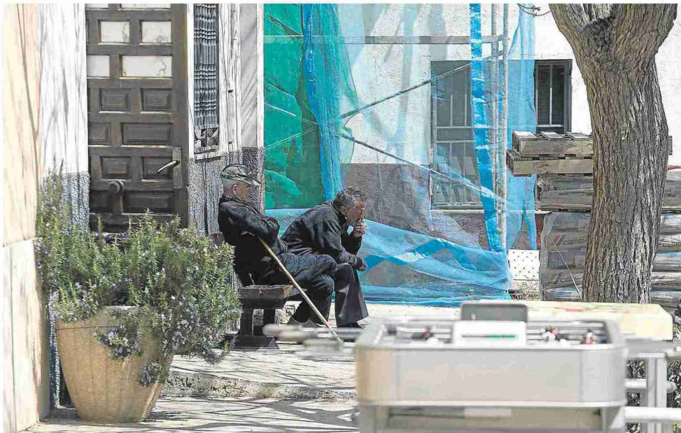
Dos vecinos se sientan al sol en la puerta del bar municipal. En primer plano, el fútbolín comunitario. L. OTAÑO