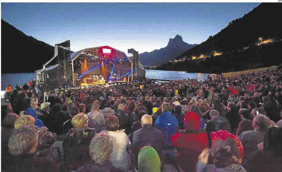
► Pirineos Sur, la gran cita de las culturas del mundo, es, sin duda, el festival aragonés con más solera y proyección.

La organización espera que se repitan las mismas cifras del año pasado y que 4.000 personas disfruten de la música en directo de los más de veinte artistas que pasarán por sus tres escenarios. Ángel Satanich, Delorentos, Carlos Sadness, Rufus T. Firefly, La Habitación Roja, La Casa Azul o Car-