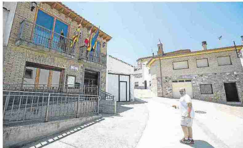
Un vecino de Botorrita camina frente al edificio del ayuntamiento. L. U.

500 habitantes, y con esa cifra el pueblo se acabará muriendo. En el colegio hay 10 niños: a muchos los empadronan en Zaragoza o María por el tema escolar. Acabamos siendo un pueblo dormitorio. Apenas tenemos una panadería, Aliaga, con mantecados y magdalenas buenísimos; no hay tienda, quedan un par de bares, la casa rural El Molino de los Yayos y poco más. En industria está Aragonesa de Hormigones Proyectados, en la zona del yacimiento. Hubo una ocasión de cambiar el panorama de golpe cuando las empresas empezaron a huir de Cataluña hace unos meses: nos preguntaron por la situación de nuestra área de polígono, que está en desuso; venían 200 trabajadores, pero por problemas con la