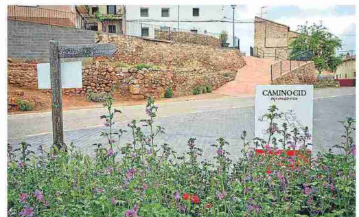
La localidad está en el Camino del Cid. J. M.