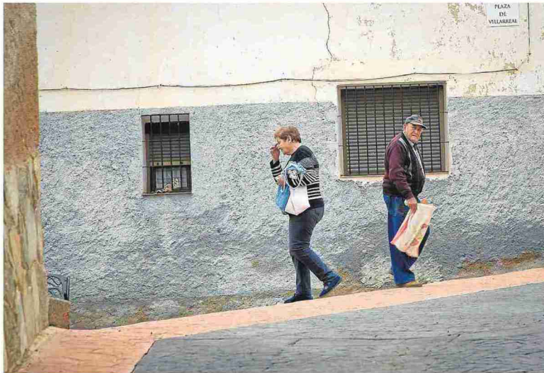
Dos vecinos se cruzan por una calle de Torrehermosa. J. M.