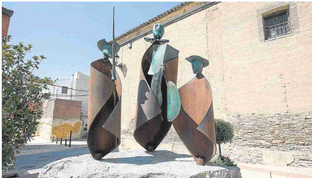
Escultura de Cervantes y Don Quijote que luce en la plaza de España de Pedrola.