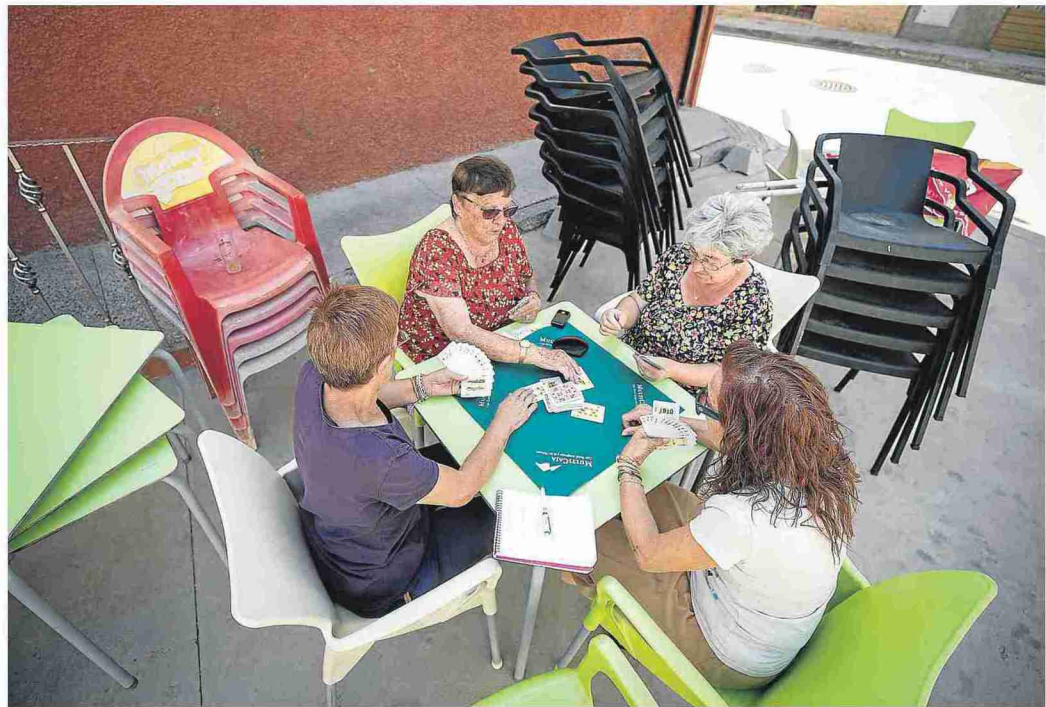
Cuatro vecinas de Langa le dan al naípe en la terraza del bar local. LAURA URANGA

También conocido como El Tío Rufino, era un poeta popular ducho en romances. Falleció en 1972. Es tan querido en el pueblo que se puede decir que hay algún ejemplar de sus escritos en casi todas las casas.