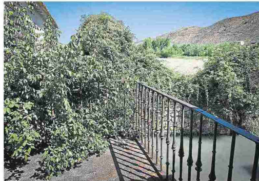
Cimballa cuenta con bellos rincones para el paseo y el descanso.