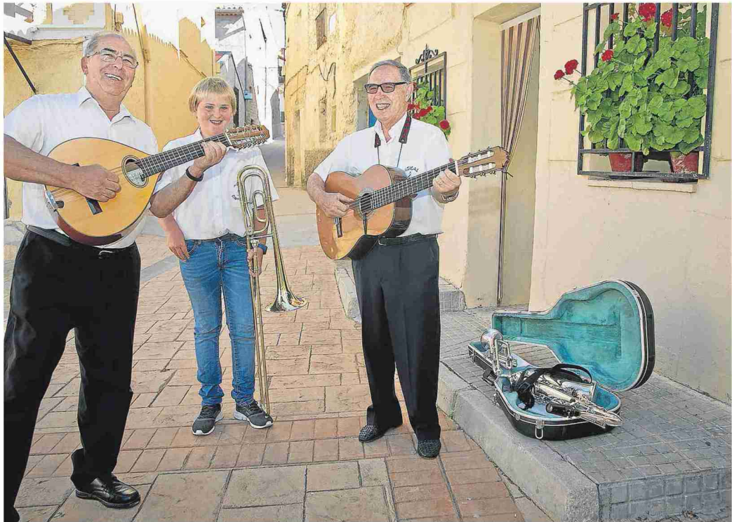
La Musical Cimballa ya está cultivando el futuro de la agrupación.