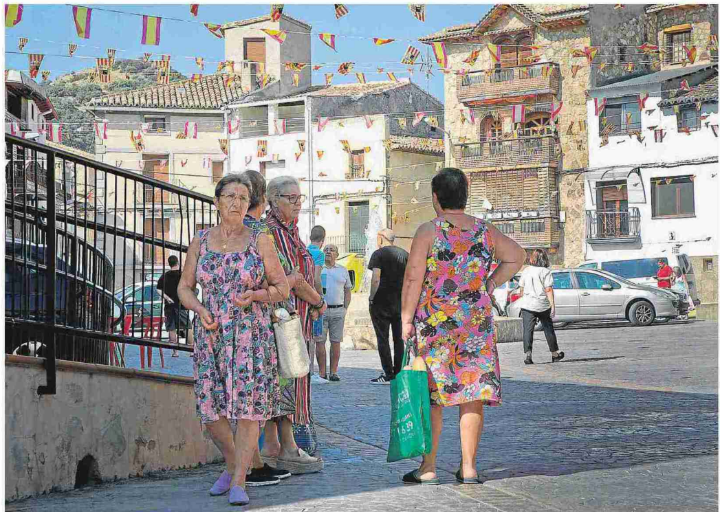
Las compras de los alimentos de primera necesidad que llegan en venta ambulante son una tradición en Carenas.

En 1959, Federico Martín Bahamontes se convirtió en el primer español en ganar el Tour de Francia. De camino a la recepción oficial de Franco en Madrid paró en Carenas; le patrocinaba Frutas Ramos, empresa oriunda del municipio.