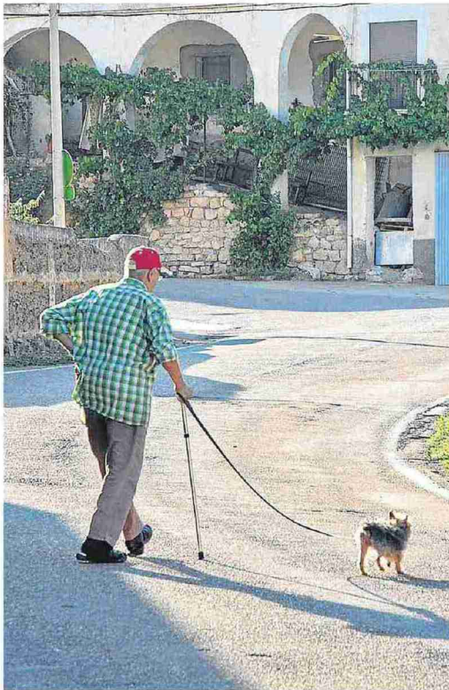
Un vecino y su perro, en el paseo vespertino. J. MACIPE