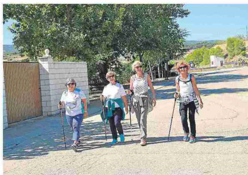
Un grupo de vecinas se aplica en el paseo.