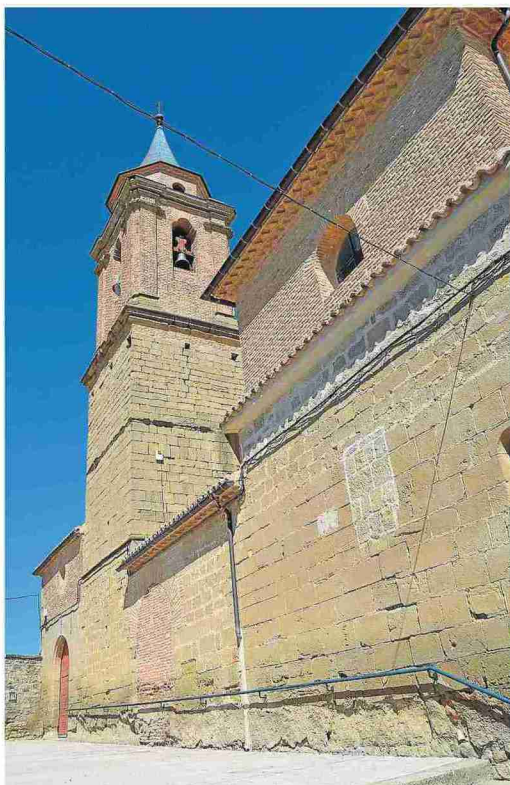
Iglesia de Santa María la Mayor. N. BARCELÓ