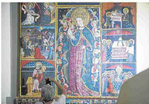
Retablo de la Virgen de los Ángeles en la parroquia. L. U.