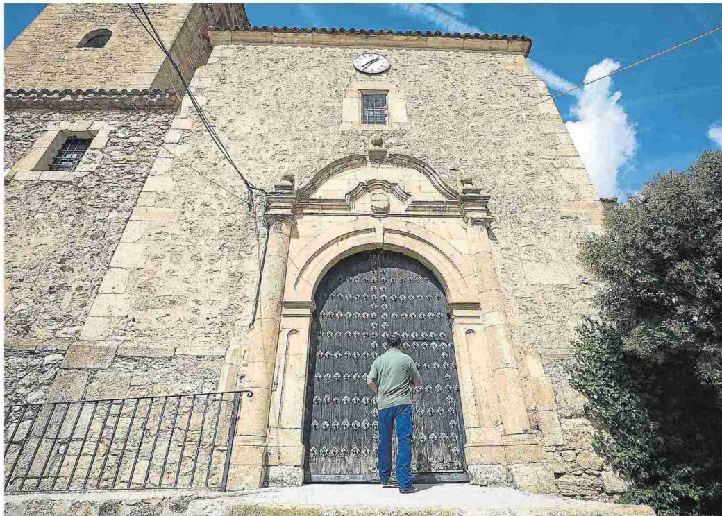
Puerta de la iglesia de la Asunción. LAURA URANGA

En el artículo de ayer, dedicado a Aldehuela de Liestos, se erró en la localización y los datos censales. El municipio pertenece a la Comarca de Daroca, tiene 53 habitantes y su distancia a Zaragoza capital es de 124 kilómetros.