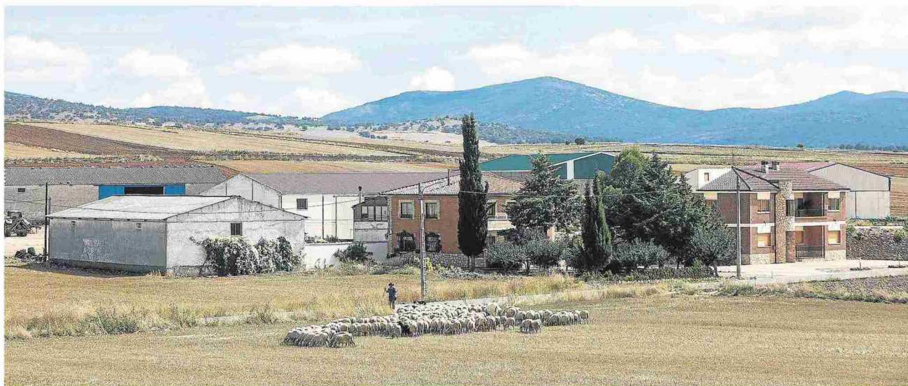
Rebaño ovino en las afueras de Cubel. L. URANGA