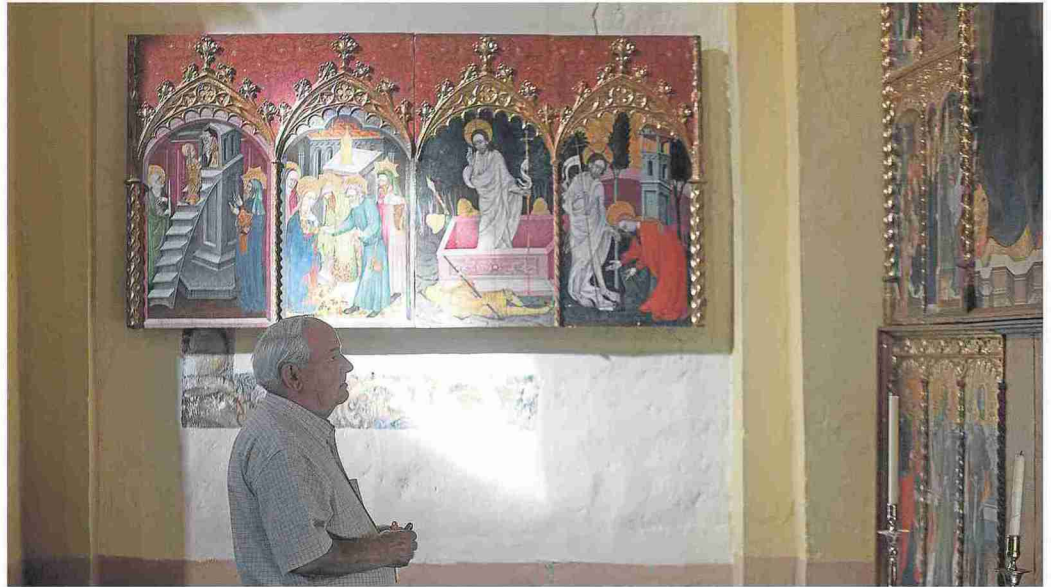
Retablos atribuidos a los maestros de Retascón y Langa, en la parroquia local. L.URANGA