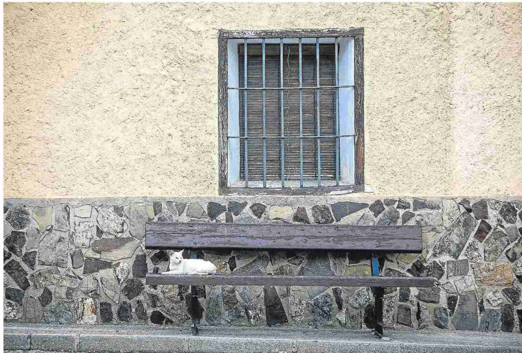
Un gato reposa sobre su banco favorito en las calles de Luesma. LAURA URANGA