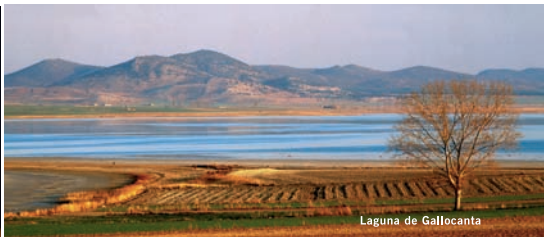
Laguna de Gallocanta