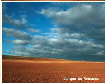
Campos de Romanos