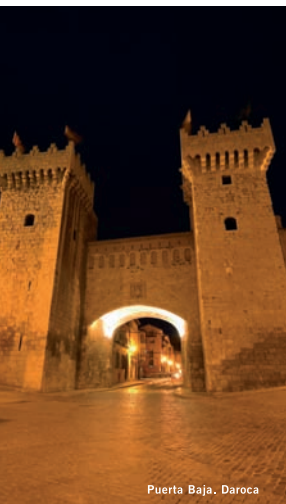
Puerta Baja. Daroca

Al sur, la Laguna de Gallocanta acoge a miles de grullas en su migración europea que resulta un espectáculo para todos los sentidos en cada primavera y otoño. Cerca se encuentra la románica y amurallada ciudad de Daroca que conserva torres, puertas fortificadas, empinadas calles, recuerdos mudéjares y dulces sefardís.