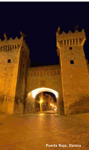
Puerta Baja. Daroca

Im Süden ist die Laguna de Gallocanta jedes Jahr Sammelpplatz tausender von Kranichen anlässlich ihrer europäischen Migration – ein Schauspiel jeden Frühling und Herbst für alle Sinne. In der Nähe befindet sich die romanische und mit einer Mauer umgebene Stadt Daroca, die noch Türme, befestigte Tore, steile Straßen, Erinnerungsstücke im Mudejarstil und Naschereien der Sefardim vorzeigen kann.