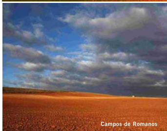
Campos de Romanos