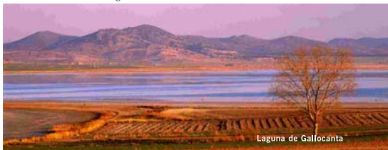
Laguna de Gallocanta