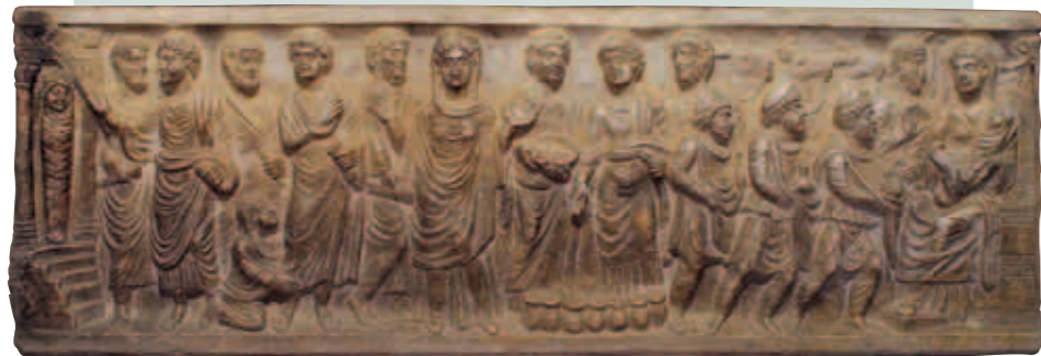
Sarcófago romano. Castiliscar

Junto a las ya citadas, un rosario de preciosas poblaciones (Bagüés, Navardún, Isuerre, Longás, Castiliscar, Luesia, Biel, Layana, Biota, El Frago, Luna, etc.) confirma un pasado de esplendores, en un opulento marco natural.