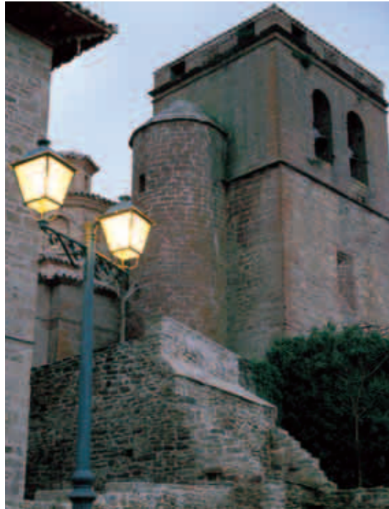
Iglesia. Undués de Lerda

El extremo norte de estas tierras, entre bosques y quebrados cursos fluviales, es atravesado por la ruta principal del Camino Santiago, el llamado camino francés. Vía de tránsito de variadas influencias culturales en época medieval, recibió una especial protección por parte de los primeros monarcas aragoneses, que impulsaron la edificación de puentes, monasterios y núcleos de población.