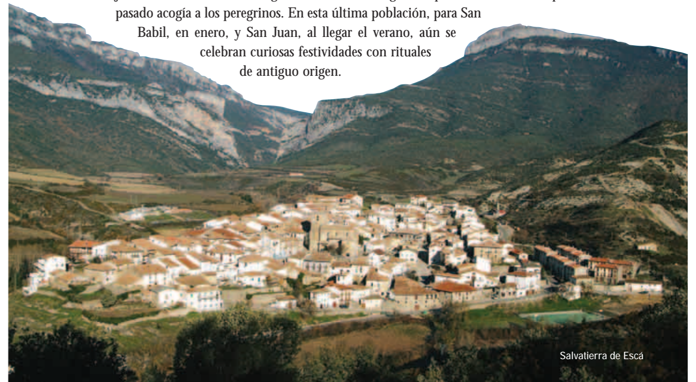
Salvatierra de Escá

Babil, en enero, y San Juan, al llegar el verano, aún se celebran curiosas festividades con rituales de antiguo origen.