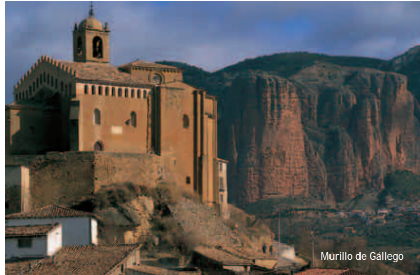
Murillo de Gállego

Junto a las ya citadas, un rosario de preciosas poblaciones (Bagüés, Navardún, Isuerre, Longás, Castiliscar, Luesia, Biel, Layana, Biota, El Frago, Luna, etc.) confirma un pasado de esplendores, en un opulento marco natural.