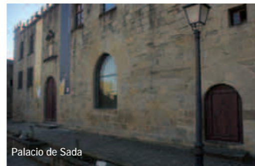
Palacio de Sada

En las estribaciones del Prepirineo se localiza la más norteña de las Cinco Villas, Sos del Rey Católico, donde parece que el tiempo se haya detenido. Recorrer su núcleo urbano, declarado Conjunto Histórico Artístico en 1968, resulta una experiencia mágica e irrepetible.