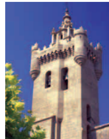
Iglesia de San Salvador. Ejea de los Caballeros

En los últimos años, la secular producción de cereales de secano se ha enriquecido con la siembra de otros productos, como el arroz, gracias al agua llegada del embalse de Yesa a través del Canal de las Bardenas. Ejea de los Caballeros es la capital de las Cinco Villas y de dicha franja de mudanza. Su caserío refleja a la perfección ese carácter de transición.