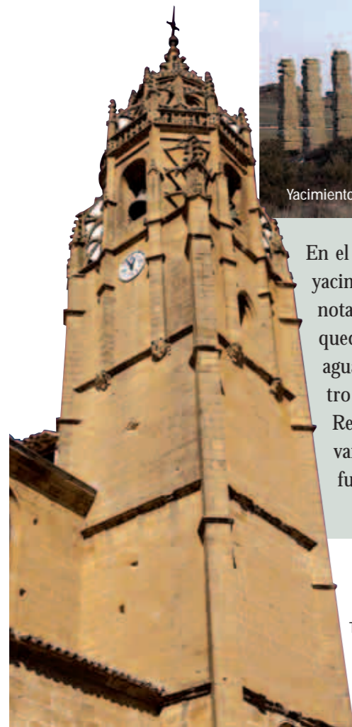
Torre. Iglesia de Sádaba

Este último, un mausoleo bajoimperial probablemente utilizado ya en ritos cristianos, se sitúa en la cercana Sádaba, villa fronteriza con el reino de Navarra señoreada por dos extraordinarias construcciones: su adusto pero formidable castillo del siglo XIII y la parroquia de Santa María, uno de los edificios góticos más sobresalientes de la provincia. A su vez, cuenta en sus cercanías con dos insignes monasterios en otro tiempo prósperos, el de Puylampa, de monjes hospitalarios, y el cisterciense de la Concepción de la Virgen de Cambrón.