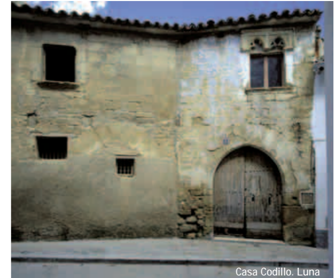
Casa Codillo. Luna

Tanto en sus enclaves arqueológicos como en sus construcciones religiosas, militares y civiles es claramente visible la herencia dejada por quienes a lo largo de los siglos se han dado cita en sus calles y en sus campos. Sobrecogen al visitante sus restos romanos, como el sarcófago paleocristiano que sirve de mesa de altar en la parroquial de Castiliscar, sus formidables iglesias de piedra sillar, sus plazas porticadas, sus viviendas tradicionales con anchos portales y ventanas talladas que parecen sacadas de cuentos de hadas, sus antiguos barrios judíos y la gallardía de sus fortalezas, encaramadas a emplazamientos inverosímiles.