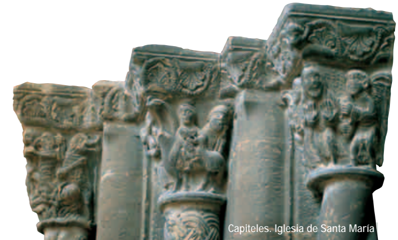
Capiteles. Iglesia de Santa María

Resulta más que recomendable una visita a la imponente loma fortificada que corona la localidad y le da nombre, donde comparten espacio una torre almenada que alberga una exposición permanente sobre la vida en la Edad Media y un palacio gótico mandado levantar por Pedro IV el Ceremonioso en el siglo XIV. En los meses estivales, además, la villa bulle de actividad. Es sede de encuentros culturales, cursos y seminarios, y se organizan festejos de particular interés, como el que recuerda a los cincuenta caballeros del lugar ajusticiados por los musulmanes en la Córdoba de Almanzor.