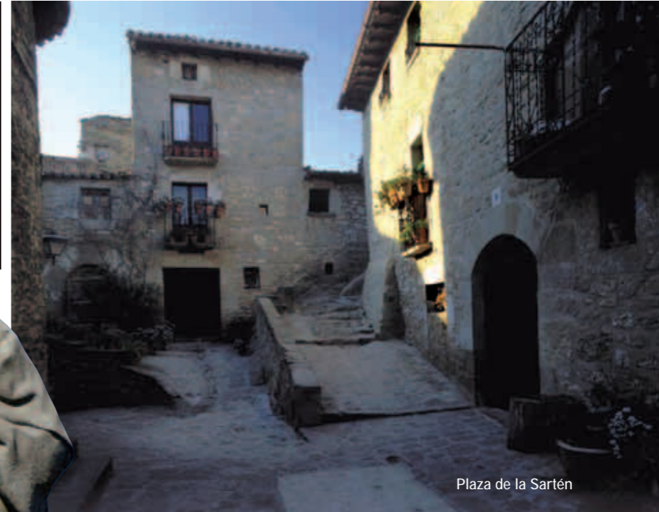
Plaza de la Sartén

En las estribaciones del Prepirineo se localiza la más norteña de las Cinco Villas, Sos del Rey Católico, donde parece que el tiempo se haya detenido. Recorrer su núcleo urbano, declarado Conjunto Histórico Artístico en 1968, resulta una experiencia mágica e irrepetible.