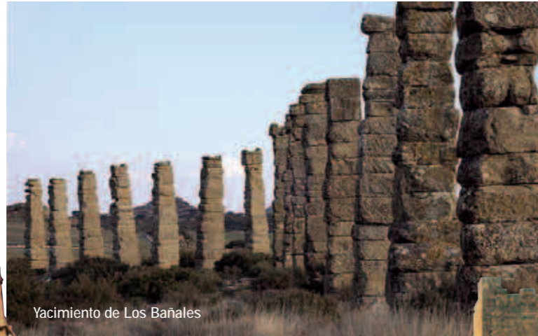
Yacimiento de Los Bañales

En el término municipal de Uncastillo se halla el yacimiento de Los Bañales, ciudad romana de notable importancia a tenor de lo que todavía queda en pie del acueducto que la abastecía de agua, de sus termas y de su foro, principal centro político y religioso de la población. Relacionadas con este asentamiento estarían varias residencias rurales y dos monumentos funerarios, el de los Atilios y "la sinagoga".