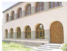
C.I. de Calcena