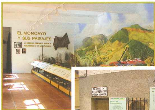
C.I. de Añón