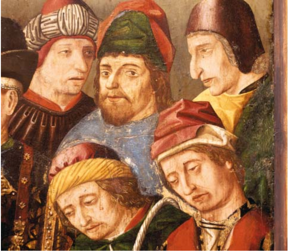
Detalle del retablo del judío, Museo de Zaragoza.

La geografía judía de la actual provincia de Zaragoza es tan rica como heterogénea, de ahí que se hayan elaborado unos itinerarios que permitan conocer con mayor exactitud la variada tipología de unas comunidades con factores de identidad diferenciadores, tanto en su patrimonio cultural como material.