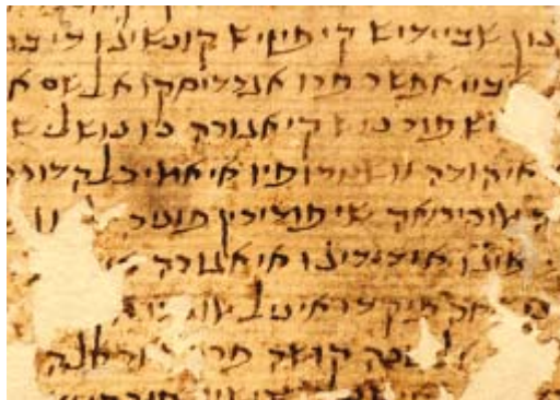
Documento hebreo.

Contó con dos barrios: la judería vieja, dentro de las murallas romanas, y la nueva o de los calliços , al otro lado del Coso, en la parroquia de San Miguel de los Navarros. La judería vieja se comunica con la zona cristiana a través de postigos –practicados a partir de 1327–, como el de San Gil, San Lorenzo o el de don Mayr , que se enclavaba en la plaza de La Magdalena. Es el núcleo monumental y residencial donde se ubica el complejo del castillo, el hospital, la sinagoga de Biqqur Holim , y la Menor, las Carnicerías (abiertas desde 1135) y los centros de enseñanza (Talmud-Tora). La sinagoga mayor que constaba de tres naves, se erigía en el solar que hoy ocupa el Real Seminario de San Carlos, y que fue adquirida por la Compañía de Jesús en 1559 para levantar la iglesia de Nuestra Señora de Belén. No es casual que el banquero converso Gabriel de Zaporta, cuya tumba reposa en La Seo, mandara construir, con motivo de su matrimonio, el palacio renacentista de los Morlanes –cuyo patio, conocido popularmente como “de la Infanta”, diseñado a modo de carta astral, permanece instalado en la sede central de Ibercaja–.