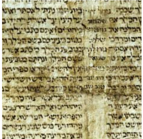
Documento hebreo. Catedral de Tarazona.

El importante financiero del siglo XIII Moshé de Portella, nacido en esta población, da nombre a la Asociación Amigos de la Cultura Judía, que ha sido capaz de integrar a todos los estamentos de la ciudad. Celebra cada año unas jornadas culturales bajo el lema “Sefarad. El retorno a Tarazona” y ha abierto recientemente un pionero Centro de Interpretación sobre la cultura judía en Aragón. El reconocimiento de estos esfuerzos le ha valido su inclusión dentro de la Red de Juderías, desde el año 2000. En su archivo capitular guarda una importante colección de documentos hebreos de carácter fundamentalmente litúrgico.