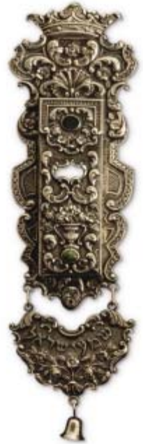
Mezuzah de procedencia aragonesa, Museo Sefardí. Toledo.

> Articulación de rutas inspiradas en la realidad de la Edad Media: Cinco Villas (Luesia, Sos, Uncastillo, Biel, El Frago, Ruesta, Luna, Tauste y Ejea); La ruta mudéjar del Moncayo (Tarazona, Borja, Mallén y Magallón); comunidades de Daroca y Calatayud; La ruta del talmud (Caspe, Híjar y Alcañiz).