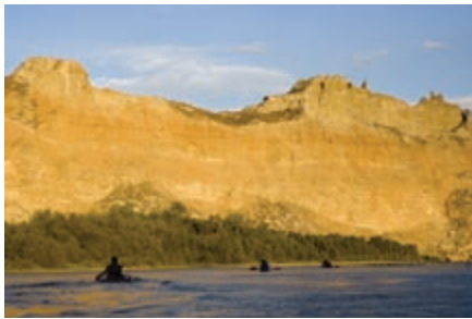
Piraguas en el río Ebro

Desde Utebo (210 m), la ruta parte en dirección Este por el camino del Alto de Machín, supera la AP-68 por un paso elevado, obvia un desvío a la torre del Tiemblo y toma el carril de la derecha que salva la acequia del Lugar, desviándose a la derecha y avanzando paralela por su parte superior hasta la bifurcación cercana a una caseta.