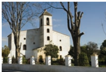
Ermita del Buen Suceso, Gelsa

Desde Pina de Ebro (160 m) se sale por el carril ribereño del parque fluvial en dirección Norte, hasta la carretera A-1107, que se toma a mano izquierda (Oeste) para cruzar el puente de Pina. A unos 300 m del extremo opuesto del puente, a la izquierda, se toma un carril paralelo al Ebro.