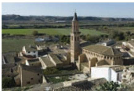
Campanario de la Iglesia de Nuestra Señora de la Asunción, Velilla de Ebro

Desde la plaza Mayor de Pina de Ebro (160 m), una calle sale en dirección Sur hacia el parque fluvial del Ebro. Enseguida, junto al río, se encuentra el cruce con la etapa 27, que viene de la derecha (Norte) por el carril ribereño. Se continúa por la izquierda, siguiendo un camino flanqueado por la ribera y las choperas municipales. Pasada una caseta, en medio del río, está la isla de la Mechana. Después, la pista gira a la izquierda y se adentra entre los chopos de cultivo.