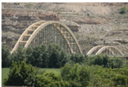
Puente en Sástago

Saliendo de Velilla de Ebro (148 m) por su parque infantil, se pasa junto al viejo molino harinero y la casa de las norias para salir a los campos. Fuera ya del recinto urbano se toma el carril más cercano al río, el camino de la Barca. Se sigue vega abajo hasta la altura de la isla de Velilla (3 km; 40 min). La pista gira al Norte para encararse de nuevo hacia Velilla, pero el camino la abandona, sube unos metros por la ladera y toma, en dirección Sur, una senda.