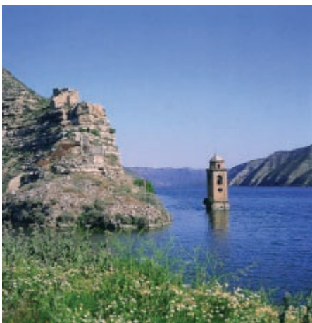
Torre inundada, Fayón

Se sale de Mequinenza (78 m) por el Sur, siguiendo la etapa 35 y tras cruzar el puente se toma, a la izquierda, la carretera A-1411, en dirección a Fayón. Pronto se abandona por su izquierda y se sigue por un carril asfaltado que vadea el barranco de la Val del Pueblo y se estrecha entre la ladera y el río.