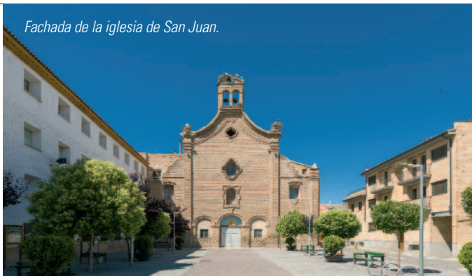
Fachada de la iglesia de San Juan.