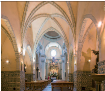
Detalle de la decoración mudéjar de la torre y el interior del templo, con su parte mudéjar en primer plano, y la barroca en la cabecera.