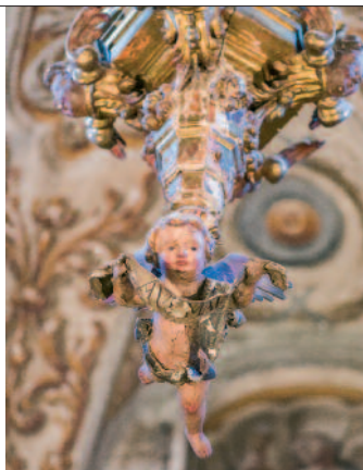
La capilla del Santo Cristo impacta nada más acceder al interior de la iglesia de San Pedro.