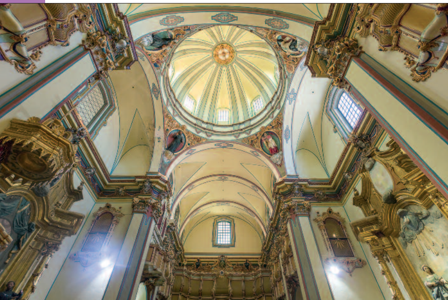
Sobre estas líneas, interior de la iglesia de San Antonio.

La decoración arquitectónica es abundante pero fina: no agobia. Los dorados, muy presentes, tampoco resultan excesivos. Y lo más llamativo es la tribuna corrida, con celosía abalconada, que recorre la parte alta del templo, esta sí de abigarrada ornamentación.