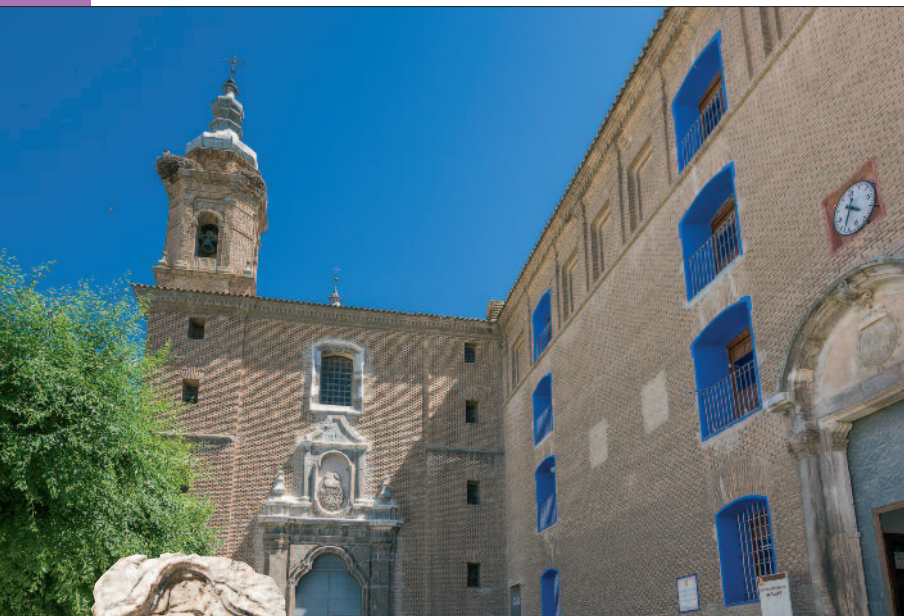
Antiguo colegio de los jesuitas e iglesia de San Antonio.