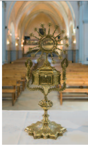
Arriba, bóveda de aproximación de hiladas en la parte inferior de la torre. A la derecha, custodia en el interior del templo.

coran su superficie (unas 5.000) y que reflejan la luz del sol. En la última restauración realizada se repusieron las piezas que faltaban, realizadas de manera artesanal.