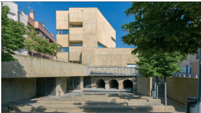
Debajo, interior del centro Mariano Mesonada. Sobre estas líneas, Centro Cultural El Molino.

Si continuamos nuestro recorrido en dirección sur, en el entorno de la estación volveremos a hallar nuevos ejemplos de arquitectura contemporánea, entre ellos los del Centro Social, el Espacio Joven, los pabellones deportivos y los espacios de la Plaza de Europa y Plaza de la Constitución, con paseos arbolados, estanques y surtidores. Frente a esta última plaza se encuentra el Ayuntamiento, obra de 1975, y si continuamos hacia el sur llegaremos al Centro Cultural El Molino, quizá el edificio más destacado del conjunto arquitectónico contemporáneo de Utebo. Realizado por Iñaki Alday y Margarita Jover, en 2004, ha recibido el Premio García Mercadal. Combina la más radical apuesta constructiva en su diseño con planteamientos que recogen los modos tradicionales de edificar, así como el recuerdo del entorno en el que se halla, que es el del antiguo molino de la localidad. La acequia de la Almozara sigue discurriendo a su lado. En el interior encontraremos un pequeño centro de interpretación dedicado a los usos del agua, el funcionamiento del molino (primero harinero, luego usado para generar electricidad): veremos las turbinas, la maqueta del viejo edificio de 1663, paneles explicativos, los antiguos cárcavos, etc.