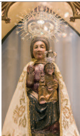
La ermita de la Virgen del Castillo se ubica en el lugar que debió de ocupar la fortaleza de Alagón. Al lado, la talla medieval de la Virgen.