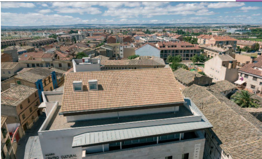
Vista de la localidad desde lo alto de la torre. Al lado, la estación de ferrocarril.