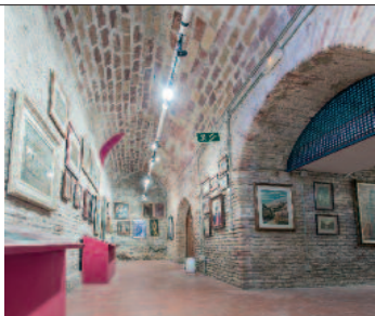
Arriba, interior del Museo Hispano Mexicano. A la derecha, fresco pintado por Goya en la lucerna de la escalera del colegio de los jesuitas.