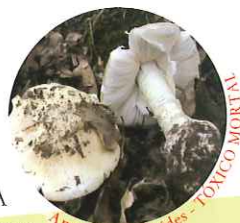
Amanita phalloides - TÓXICO MORTAL